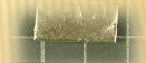
Свёрток из фольгированной бумаги используемый для хранения