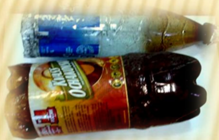
Самодельные приспособления для курения наркотических средств